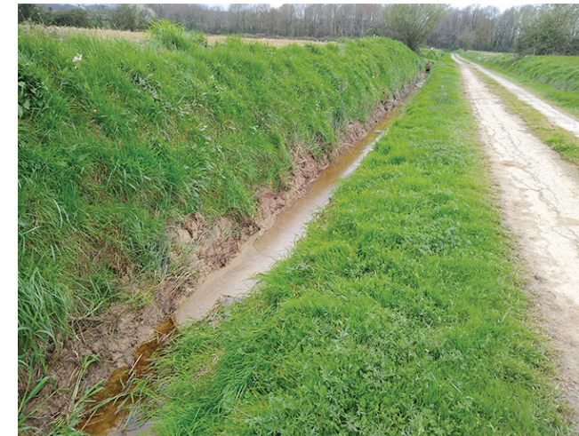
Chemin du Lavoir

La campagne de curage des fossés a été réalisée dans le courant des mois de février et mars et a concerné les chemins de La Bachotte, de Piqûre, du Lavoir de Saint-Laurent, de la Croix et du chemin de Biroulet. Un enrochement a été réalisé sur le pont du chemin des Arrious. Montant des travaux estimé : 4 215 € HT.