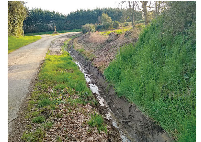
Chemin de la Croix