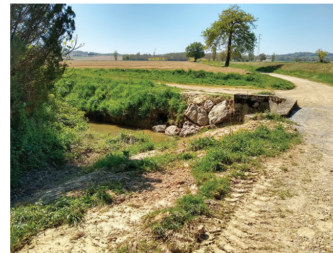
Enrochement chemin des Arrious